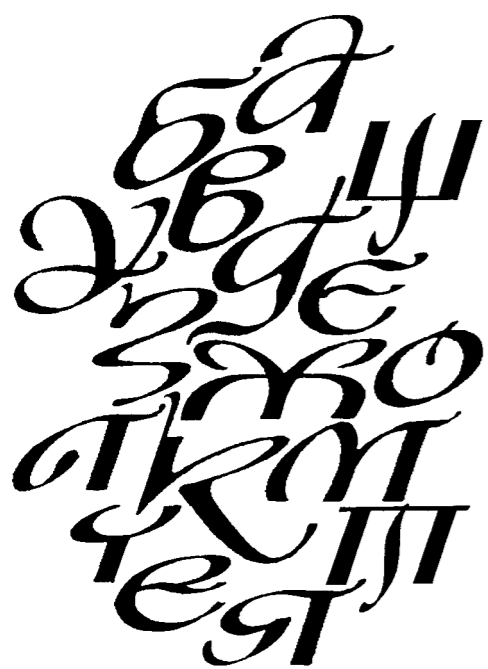
В. Чебаник. Проект шрифта. Плоский карандаш, гелевая ручка, прорисовка в «Фонтлабе»