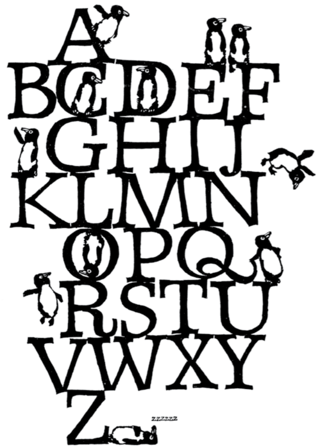
А. Окимото. Алфавит Бумага, тушь, широко- конечные перья, резьба по дереву, оттиск на бумаге