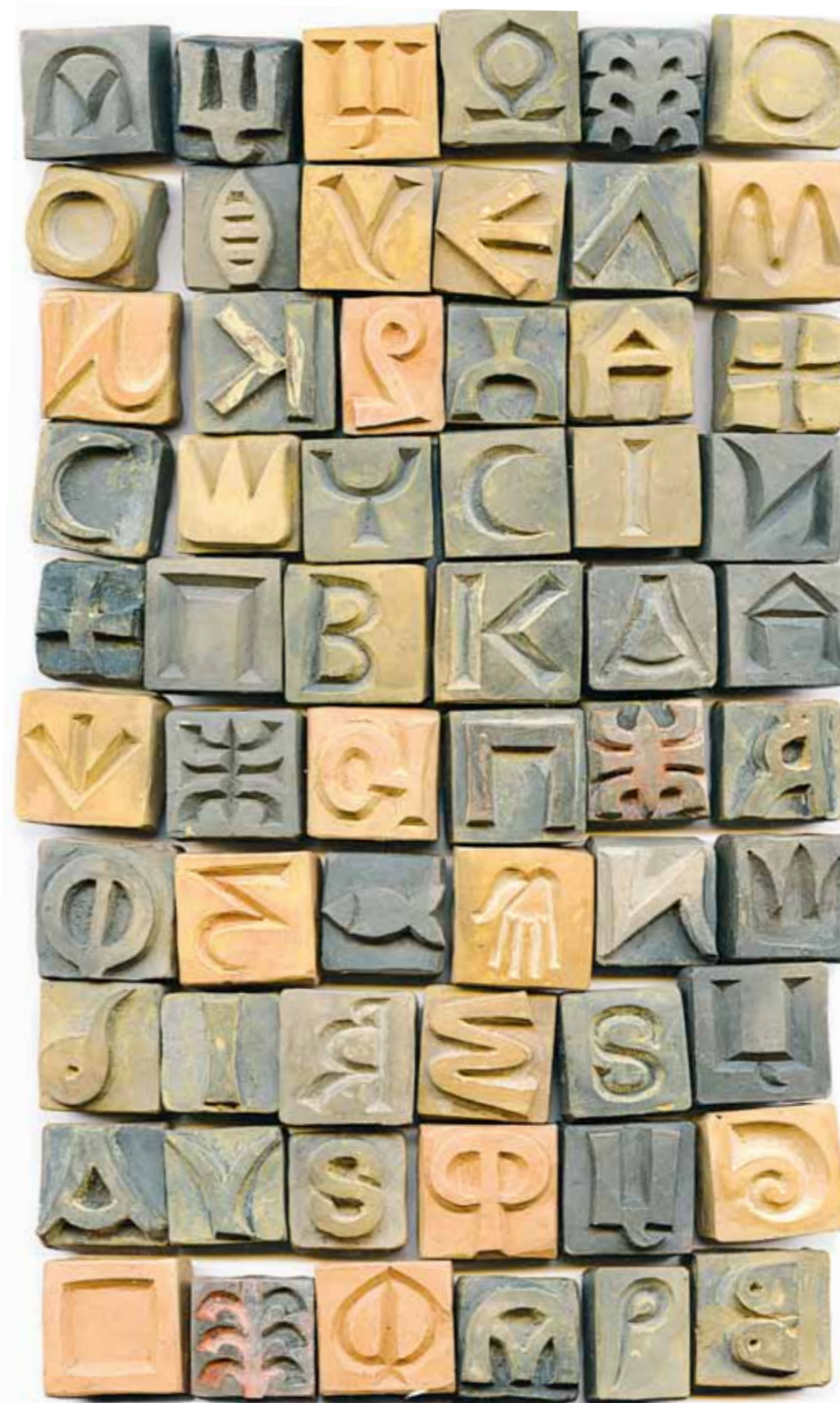
П. Мартыненко Керамические литеры Смешанная техника