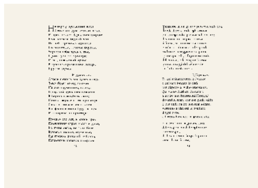
Разворот книги «Медный всадник» со шрифтами Лазурского и Мардерштейга. См. с. 76–77

Шрифтом Лазурского в Италии отпечатана книга «Медный всадник» А. С. Пушкина. Параллельно русскому тексту идет итальянский, набранный шрифтом Данте. Его создал Джованни Мардерштейг из Вероны. Он и отпечатал в 1968 году русско-итальянский вариант Медного всадника на ручном прессе.